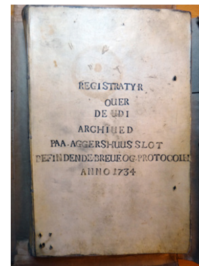
Tittelside til Akershusregistraturen av 1734, utarbeidet av Peter Vogt og Andreas Lachman.